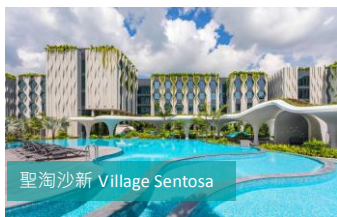
聖淘沙新 Village Sentosa